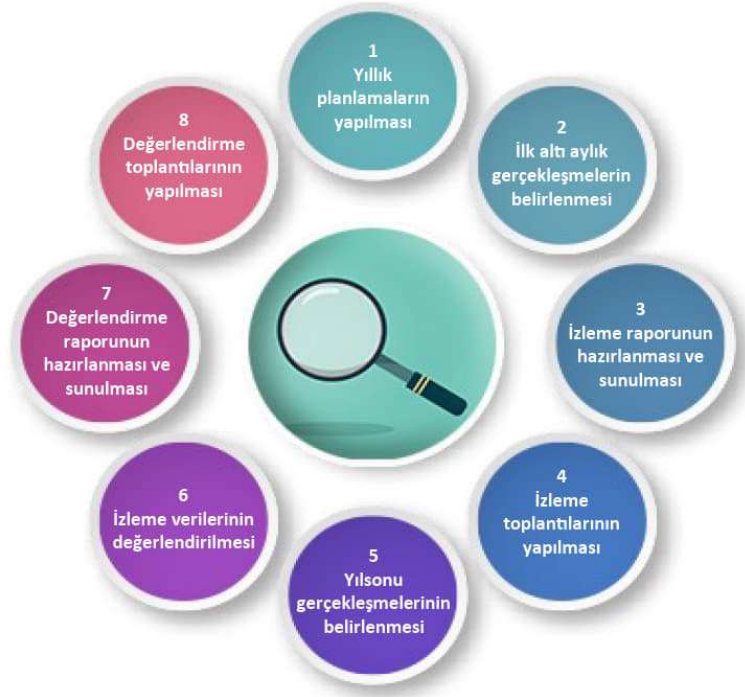
Şekil-4 İzleme ve Değerlendirme Süreci

İzleme ve değerlendirme sürecinin işleyişi ana hatları ile yukarıdaki şekilde özetlenmiştir.